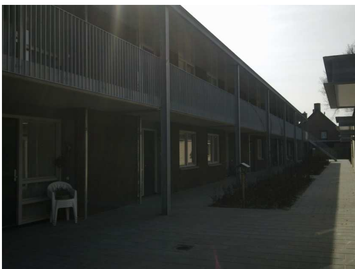
senioren- en zorgwoningen direct aan steunpunt d'n Bogerd

Steunpunt Den Bogerd is een aantal jaar geleden gerenoveerd en uitgerust met een professionele keuken, aangepaste toiletten, een aangepaste natte cel, een grote zaal en diverse kleinere ruimtes. Direct aan het zorgcentrum liggen 5 oudere seniorenwoningen en 14 zorgwoningen die in december 2009 opgeleverd zijn. De ouderen die hier wonen maken dagelijks gebruik van het steunpunt, voor een kopje koffie, een potje biljarten of zelfs de dagbesteding. Een aantal bewoners van de woningen is bovendien vrijwilliger in het steunpunt. Verschillende bewoners van de senioren- en zorgwoningen maken gebruik van de thuiszorgdienst van de zorgcoöperatie Hoogeloon.