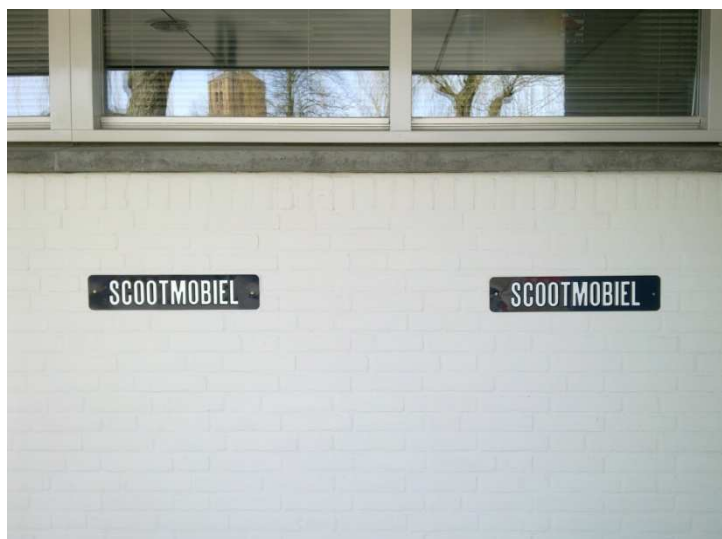
parkeerplaats voor scootmobielen