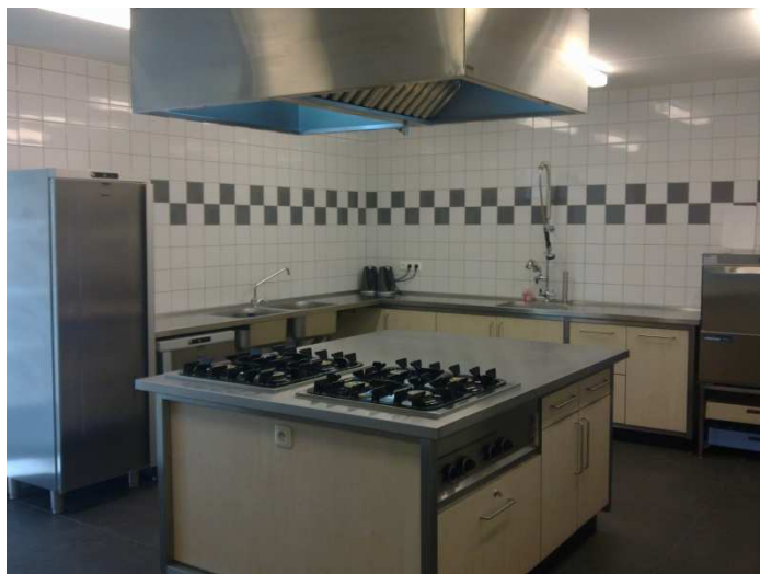
vernieuwde keuken in steunpunt d'n Bogerd

Steunpunt Den Bogerd is een aantal jaar geleden gerenoveerd en uitgerust met een professionele keuken, aangepaste toiletten, een aangepaste natte cel, een grote zaal en diverse kleinere ruimtes. Direct aan het zorgcentrum liggen 5 oudere seniorenwoningen en 14 zorgwoningen die in december 2009 opgeleverd zijn. De ouderen die hier wonen maken dagelijks gebruik van het steunpunt, voor een kopje koffie, een potje biljarten of zelfs de dagbesteding. Een aantal bewoners van de woningen is bovendien vrijwilliger in het steunpunt. Verschillende bewoners van de senioren- en zorgwoningen maken gebruik van de thuiszorgdienst van de zorgcoöperatie Hoogeloon.